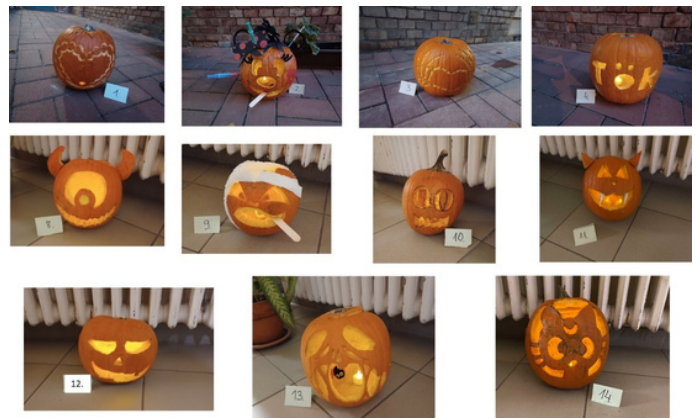
Tökfaragó verseny ETSZK 2024